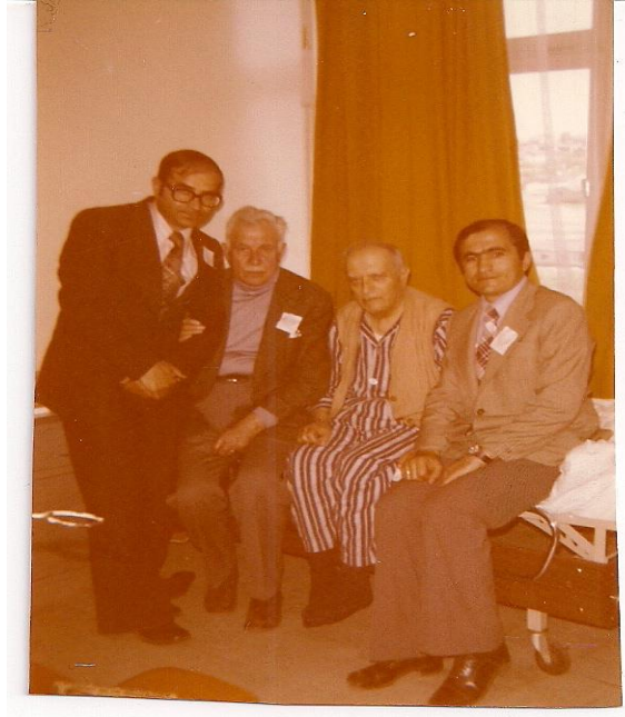
Resim 9